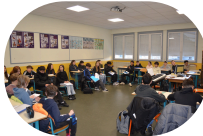
salle de musique