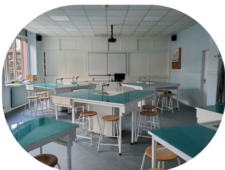
Laboratoire de sciences