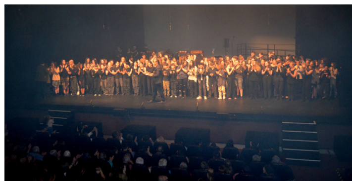
Spectacle fin d'année Théâtre et Chorale