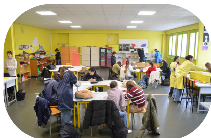
Salle d'arts plastiques