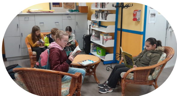
Coin lecture au CDI

Horaires Cours de 8h à 11h55 Pause repas Cours de 13h20 à 16h35