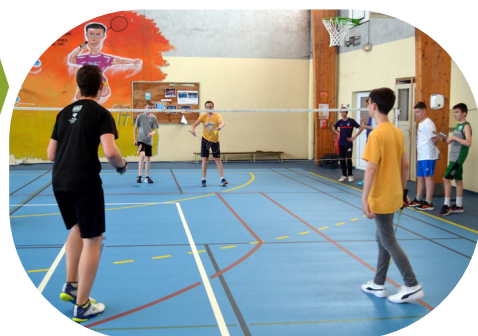
Salle de sport du collège