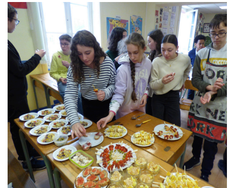
Atelier cuisine en section euro espagnol