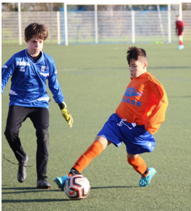
Section Sportive Football